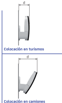
Colocación en turismos