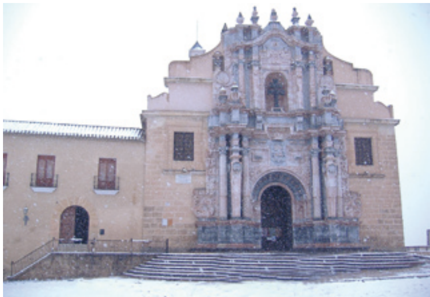
Caravaca de la Cruz.