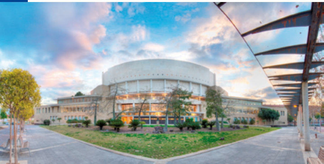
Auditorio y Centro de Congresos Victor Villegas de Murcia